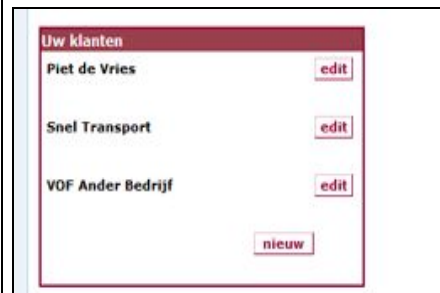
Screenshots aanmaken en beheren klanten